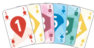
Karty v ruce