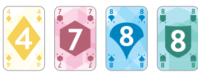
4 karty lícem nahoru